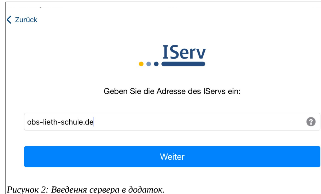
Рисунок 2: Введення сервера в додаток.